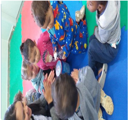
Atividade 4: Expressar