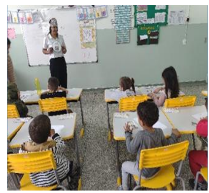
Atividade 3: Explorar